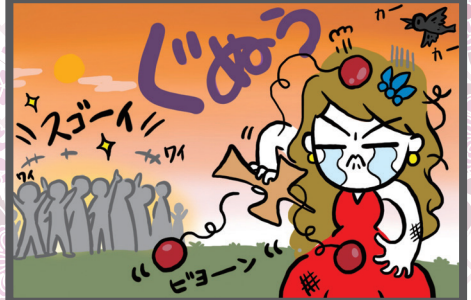
原案:ポポラーレ編集委員 イラスト:モモリアキヨ