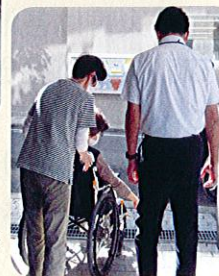
周辺の道路や段差で実習