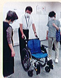
車いすの使い方や種類などをレクチャー